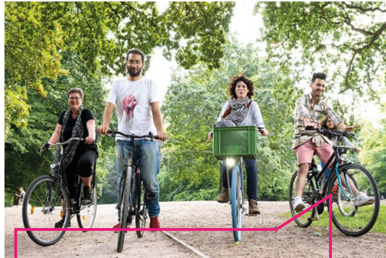
Präventive Angebote an bundesweit rund 190 Standorten

Eine eigene Säule im Programm bilden die Bildungsangebote von Trägern der politischen Jugendbildung in der GEMINI, die in Kooperation mit den Respekt Coaches an Schulen umgesetzt werden. Thematisch stehen hier vor allem Bildungsangebote zu Mobbing, Persönlichkeitsstärkung, Respekt und Toleranz, Religion und Identität oder auch die Reflexion von Geschlechterrollen im Vordergrund. Zentrales Ziel der Angebote der politischen Bildung im Programm ist es, die Selbstpositionierung und Resilienz von Jugendlichen zu stärken und demokratische Aushandlungsprozesse zu üben. Die beteiligten Teilprojekte der GEMINI verfolgen in diesem Sinne einen primärpräventiven und ressourcenorientierten Ansatz und richten sich an alle Jugendlichen, unabhängig von Religion und Herkunft. Sie wollen insbesondere diejenigen stärken, die extreme Ansprachen erkennen und sich aktiv dagegen zur Wehr setzen wollen. In diesem fachlichen Selbstverständnis folgen die Träger der politischen Jugendbildung einem Präventionsbegriff, der in der Arbeit mit jungen Menschen an den Stärken und dem demokratischen Gestaltungswillen der Jugendlichen